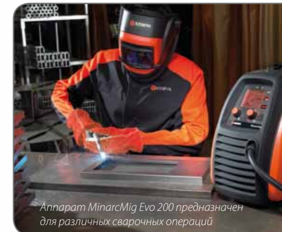
Аппарат MinarcMig Evo 200 предназначен для различных сварочных операций