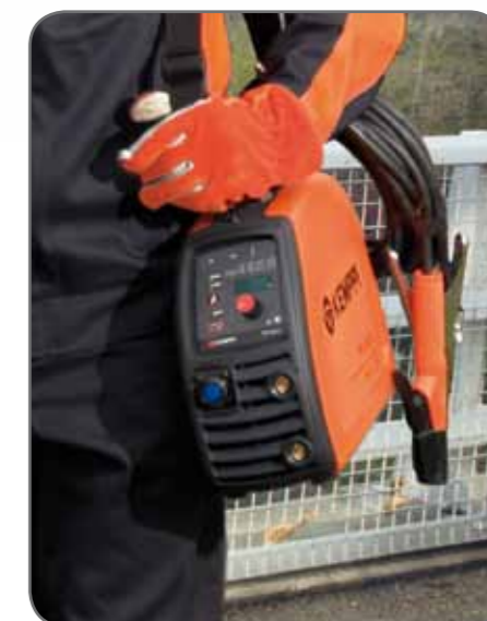
Малый вес, компактность и высочайшая мобильность