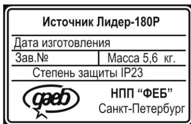
Рисунок 2 – информационная шильда

На задней панели аппарата расположена информационная шильда (рисунок 2).